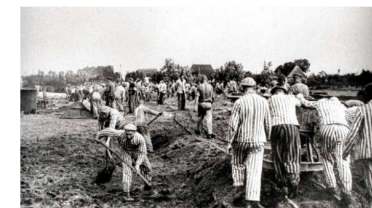
Häftlinge aus dem Konzentrationslager Neuengamme heben den Stichkanal von dem auf dem Gelände gelegenen Klinkerwerk zur Dove Elbe aus (Foto der SS, etwa von 1941/42). PA/dpa

In 18 weiteren Curiohaus-Prozessen zum Komplex Neuengamme mussten sich 53 Männer und 19 Frauen wegen Tötungen und Misshandlungen von Gefangenen verantworten. Zu den Angeklagten im Prozess um Verbrechen im KZ-Außenlager Hannover-Ahlem gehörte auch Otto „Tull“ Harder. Der legendäre Stürmer des HSV und Kapitän der Nationalmannschaft war in den 1920er-Jahren ein Fußball-Idol. Harder gehörte von 1939 an zum Wachpersonal in Neuengam-