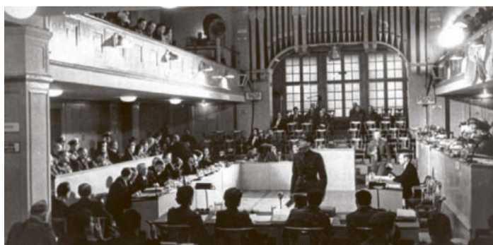
Blick in den zum Gerichtssaal umfunktionierten großen Saal des Curiohauses: Links unter der Loge sitzen die Angeklagten, davor ihre Verteidiger, auf der rechten Seite das Gericht. Von 1946 bis 1949 fanden 188 Prozesse gegen NS-Kriegsverbrecher mit 508 Angeklagten vor britischen Militärgerichten statt.