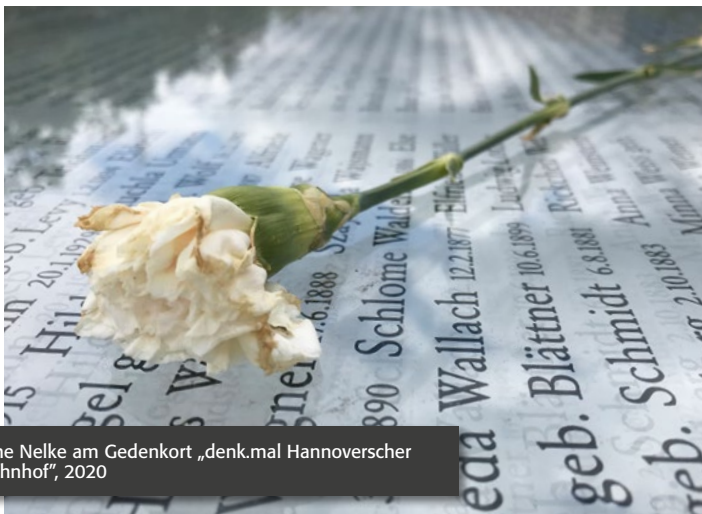
Eine Nelke am Gedenkort „denk.mal Hannoverscher Bahnhof“, 2020