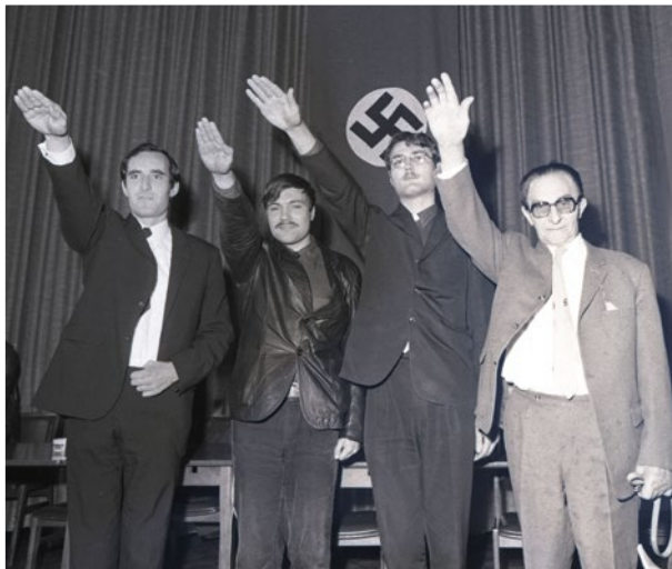
Neonazis bei einem internationalen Treffen im Haus des Sports in Hamburg-Eimsbüttel, 10. November 1974