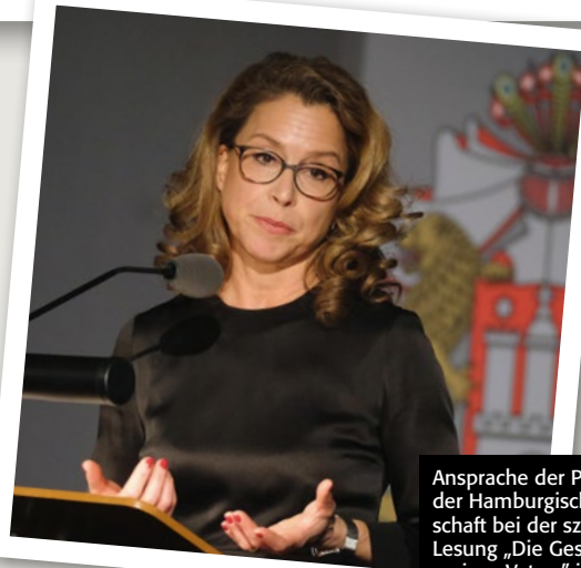
Ansprache der Präsidentin der Hamburgischen Bürgerschaft bei der szenischen Lesung „Die Gesichter meines Vaters“ im Januar 2023

Der 27. Januar ist inzwischen international ein Tag des Gedenkens an die Opfer des Nationalsozialismus. Seit über zwanzig Jahren richtet die KZ-Gedenkstätte Neuenamme bzw. nunmehr die Stiftung Hamburger Gedenkstätten und Lernorte zur Erinnerung an die Opfer der NS-Verbrechen auf Einladung und mit Unterstützung der Hamburgischen Bürgerschaft aus diesem Anlass eine Ausstellung im Hamburger Rathaus aus.