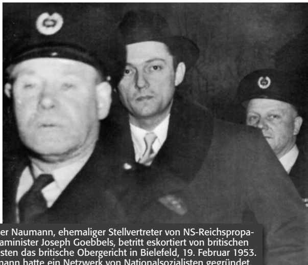
Werner Naumann, ehemaliger Stellvertreter von NS-Reichspropagandaminister Joseph Goebbels, betritt eskortiert von britischen Polizisten das britische Obergericht in Bielefeld, 19. Februar 1953. Naumann hatte ein Netzwerk von Nationalsozialisten gegründet, deren Ziel die Machtübernahme in der Bundesrepublik war.

Um Anmeldung wird gebeten: https://www.gedenkstaetten-hamburg.de/de/veranstaltungen