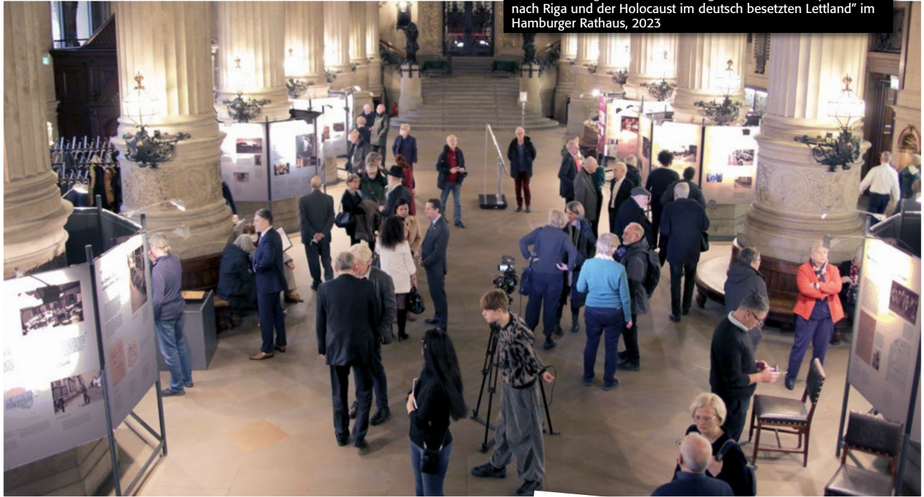
Die Ausstellung „Der Tod ist ständig unter uns. Die Deportationen nach Riga und der Holocaust im deutsch besetzten Lettland“ im Hamburger Rathaus, 2023